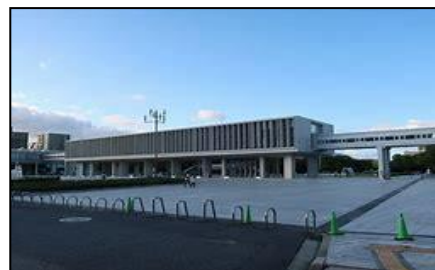
広島平和記念資料館

私たちは8年ほど前から、神戸市に対し「記念館をつくってほしい」と要望書や署名提出などの運動をしてきました。しかし久元市政は「HPがある」「兵庫図書館に戦災記念資料室がある」等の理由で否定しています。